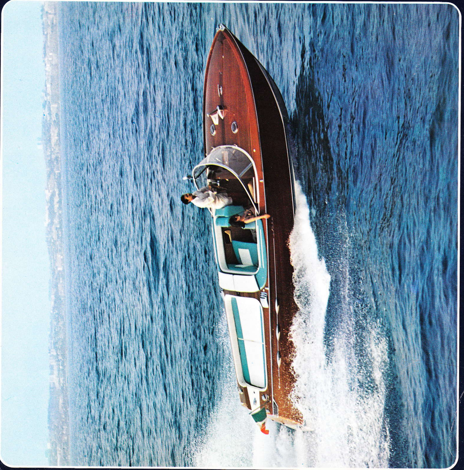
Rio Colorado Autentico capolavoro che vive e abita sull'acqua